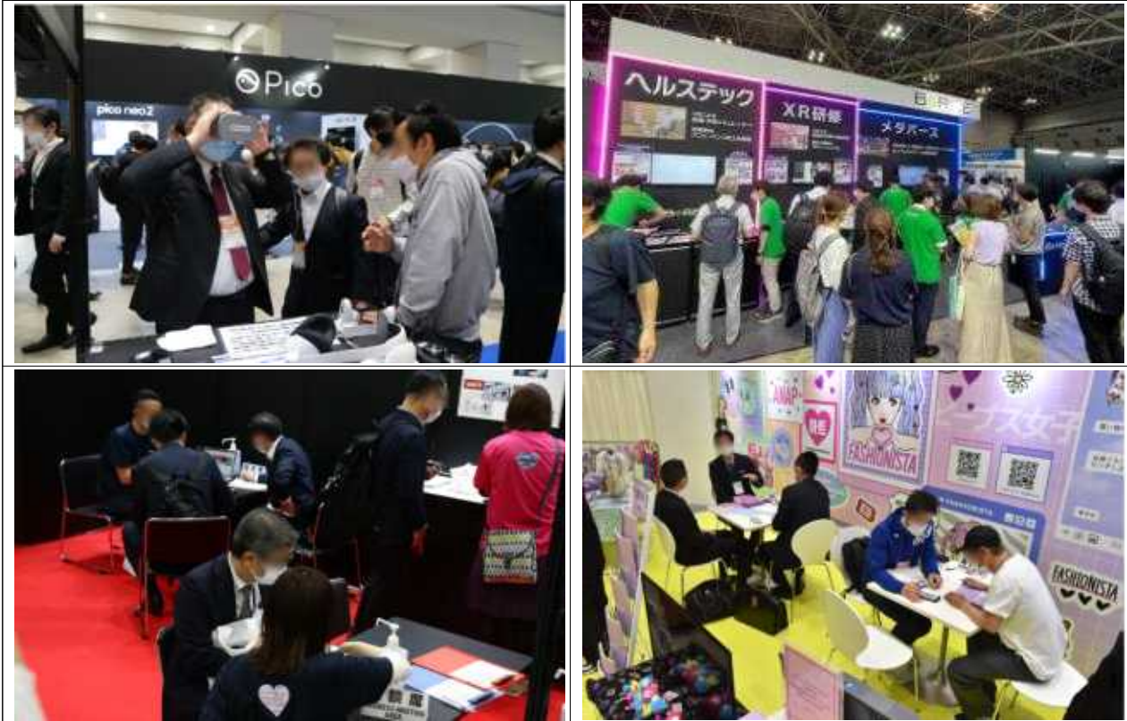
XR Fair Tokyo Autumn 현장

□ 지원내용안 : 공동관 설치 및 홍보 지원, 비즈니스 매칭지원(네트워킹 및 바이어 미팅)