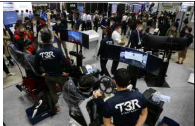
XR Fair Tokyo Autumn 현장